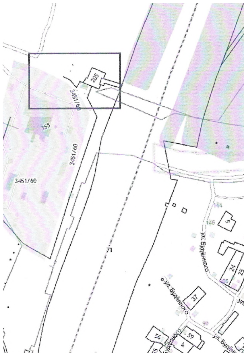
Схема границ территории проектирования переподключения водопровода (район зд. 3 ул. Полярная)

— Граница территории, применительно к которой осуществляется подготовка документации по планировке территории