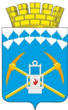
СХЕМА ТЕПЛОСНАБЖЕНИЯ БЕЛОВСКОГО ГОРОДСКОГО ОКРУГА ДО 2030 ГОДА АКТУАЛИЗАЦИЯ НА 2023 ГОД

Обосновывающие материалы к схеме теплоснабжения: