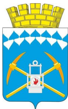
СХЕМА ТЕПЛОСНАБЖЕНИЯ БЕЛОВСКОГО ГОРОДСКОГО ОКРУГА ДО 2030 ГОДА АКТУАЛИЗАЦИЯ НА 2023 ГОД

Обосновывающие материалы к схеме теплоснабжения: