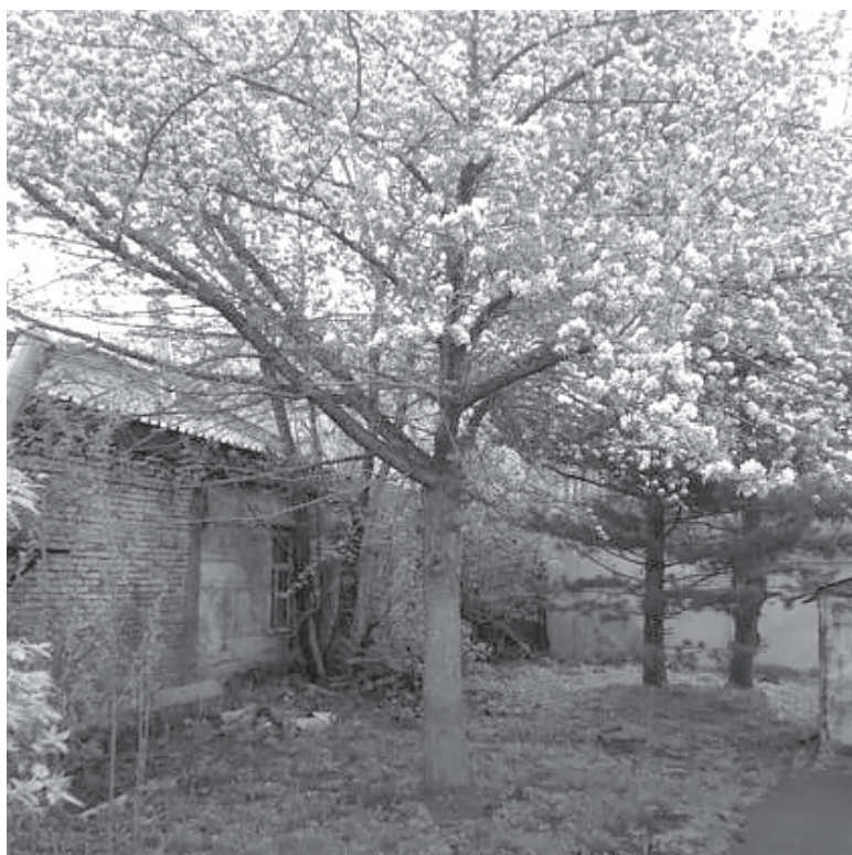
■ Яблони зацвели в Кемерове.

«Действительно, из-за мощной волны тепла, которую принес антициклон из Южного Казахстана, в Кузбассе в апреле 2020 года отмечаются очень высокие температуры – до +30 градусов. Мы еще не считали, но по предварительным оценкам, средняя температура третьей декады месяца будет значительно выше нормы. Благодаря этому практически летнему теплу вегетация началась раньше средних многолетних сроков примерно на две-три недели», – поясняет начальник отдела гидрометеобеспечения Кемеровского гидрометцентра Светлана Наумова.