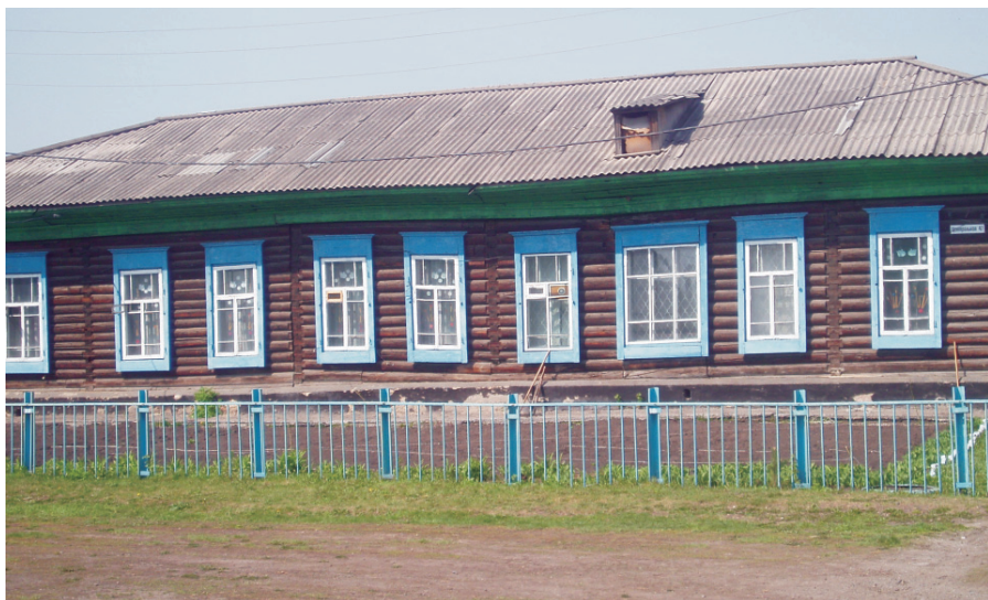
Здание Караканской школы. Построено более ста лет назад.