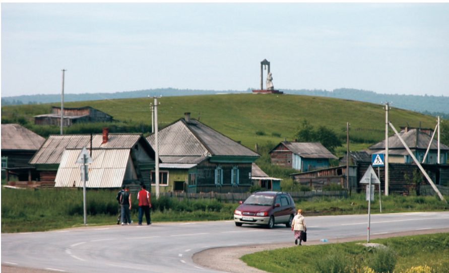
Дорога на Гурьевск. Деревня Шанда. Здесь проходил тракт на Салаир.