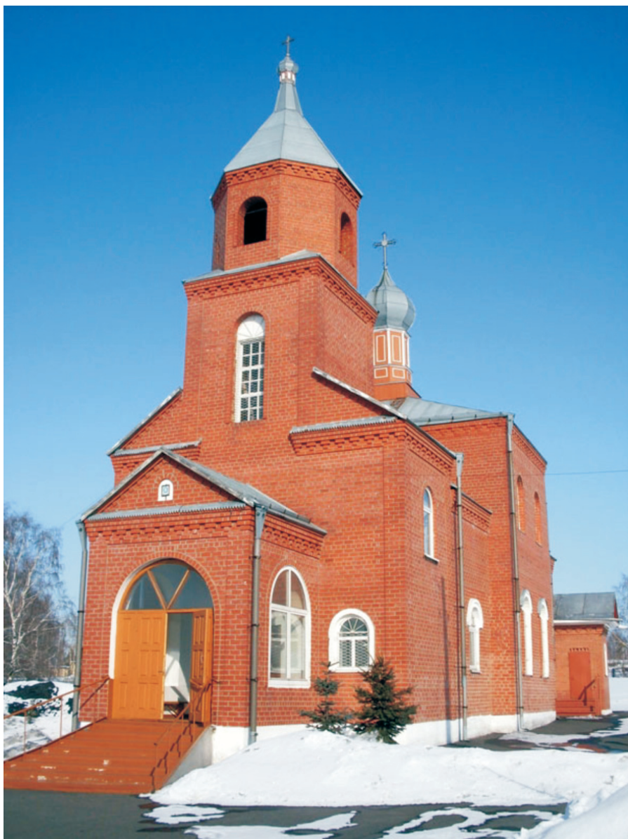
Храм Серафима Саровского в посёлке Грамотейно. Построен на территории бывшей Николаевской волости.