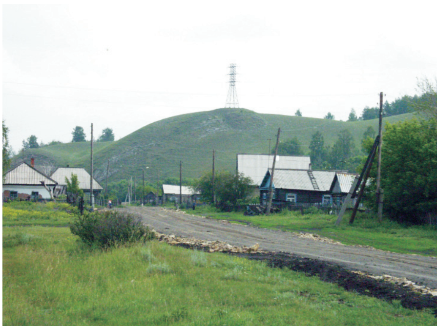
Вид на гору Крестовую. Село Заречное.