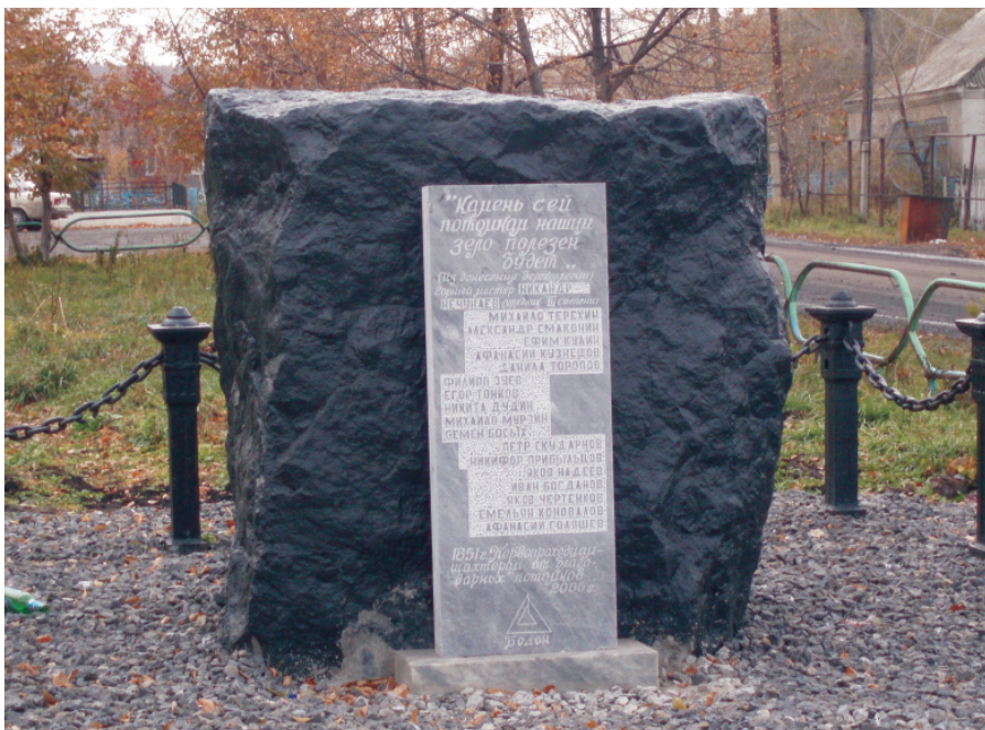
Памятный камень в селе Новобачаты, установленный в честь первых угледобытчиков Кузбасса.