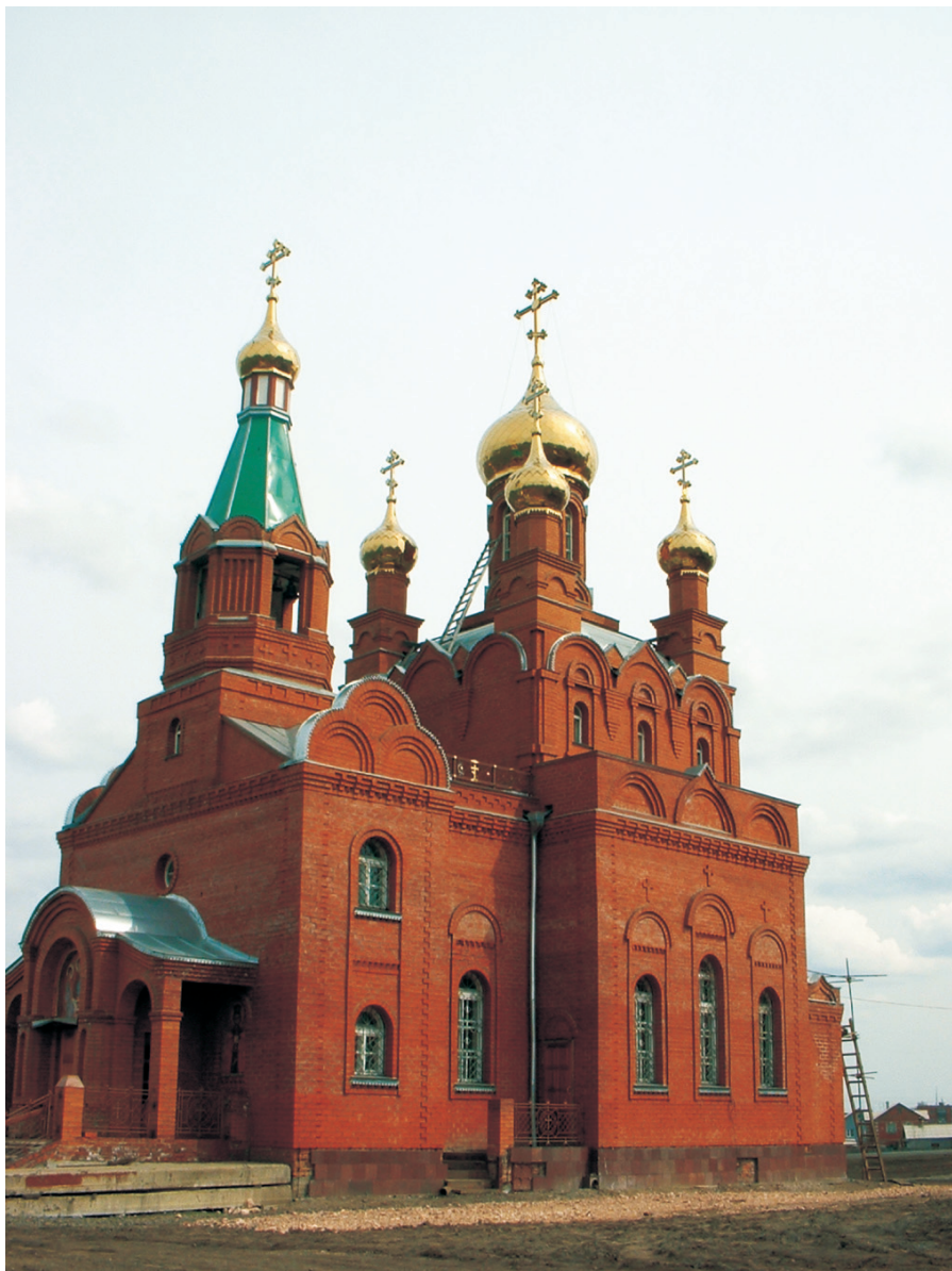
Храм Святой Троицы в посёлке Инской. Построен на бывшей территории Николаевской волости Кузнецкого уезда.