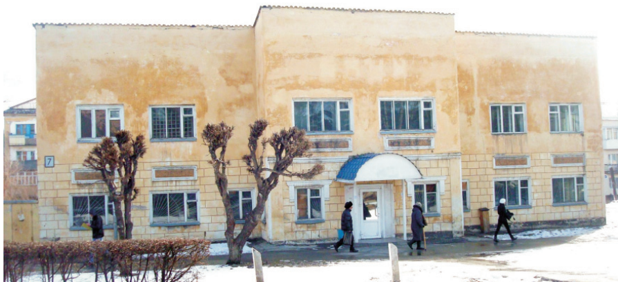
Здание бывшего Госбанка по улице Советской. Ныне не используется.