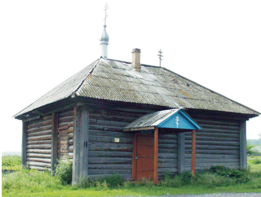
Православный приход в селе Заречном. Первоначальный вид.