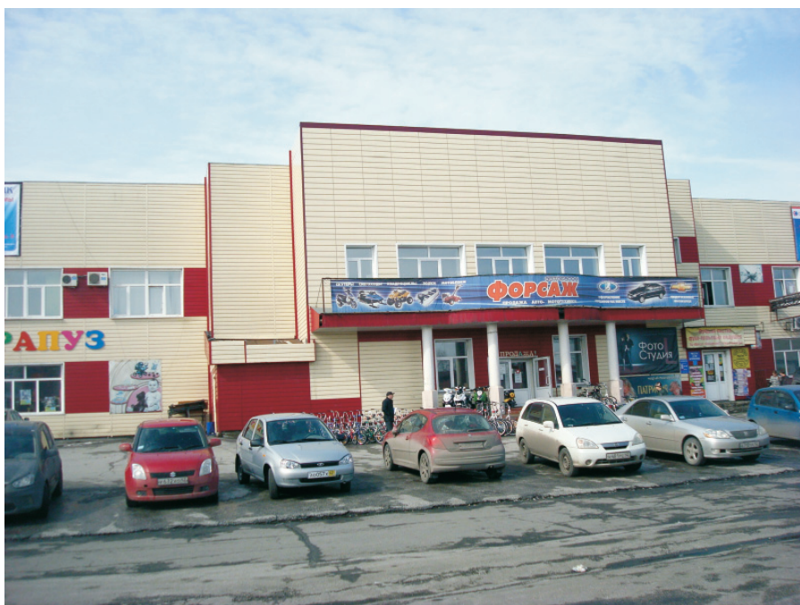
В этом здании в 30-х годах прошлого века располагался Дом Советов.