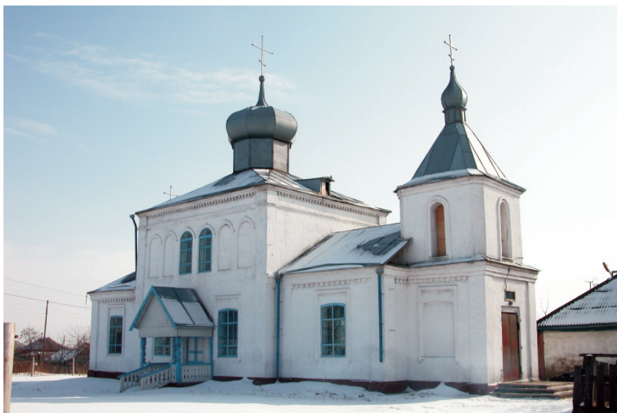
Пантелеймоновский храм в селе Беково. Освящён в 1890 году.